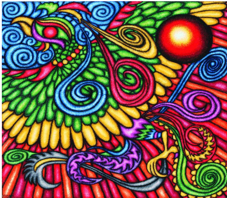
Resim-5 'Zümrüdü Anka'

Resmin Yorumu: Erkek sanki gururla kabarıyor, kız ise onu beğeniyle seyrediyor. Birbirlerine hafifçe dokunuyorlar. Bunu sıcak bir kucaklaşma izliyor. Tan ağarırken doğadaki en zarif danslardan birinin ritmiyle uyum içinde hareket etmeye başlıyorlar. Bu dansın adı denizatının ölümsüz aşkıdır. Sanatçımız Ölümsüz Aşk eserinde deniz atlarını gökyüzü ve suyun rengi mavi yaparak izleyicilere sonsuzluğu ve huzuru yansıtmaktadır. Denizatlarının birbirlerine ağız kısımlarında aşk ve tutkuyla bağlandıklarını görmekteyiz Sanatçımız gözlerinde kullandığı kırmızı renk ile aşklarının ne kadar tutkulu, kuvvetli olduğunu biz izleyicilere aktarmaktadır. Sarı ve kırmızı renklerden oluşan güneş ve onun ışınları gibi eserin tüm zemini kaplayan sarı, kırmızı, yeşil, mavi renklerden meydana gelen formlarla aşka, hazzı, evliliğe, tutkuya, sonsuz yaşama, masumiyete, inanca, birlikteliğe dikkat çekmektedir. (Resim-4)