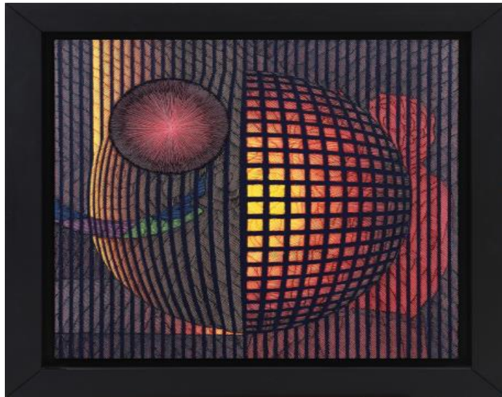
Resim-2 'Men-ü- Zin'in Rüyası'

Resmin Yorumu: Bu eserde güneşi ölümcül karanlığın içindeki ışık kaynağı olarak ve kırmızı rengi kullanırken yer ve gök unsurlarının bir devamı olarak resminde kullanmıştır. Çalışmasında yer alan şahmeran motifi ile Yeryüzünde hemen tüm topluluklarda hem olumlu hem olumsuz nitelikler yüklenmiş bir sembol olan yılan; yaşam, ölüm, sihir ve bilgiyle ilişkilendirilmiştir. Mavi rengi barış, sadakat anlamında da kullanmıştır. ( Resim-1 )