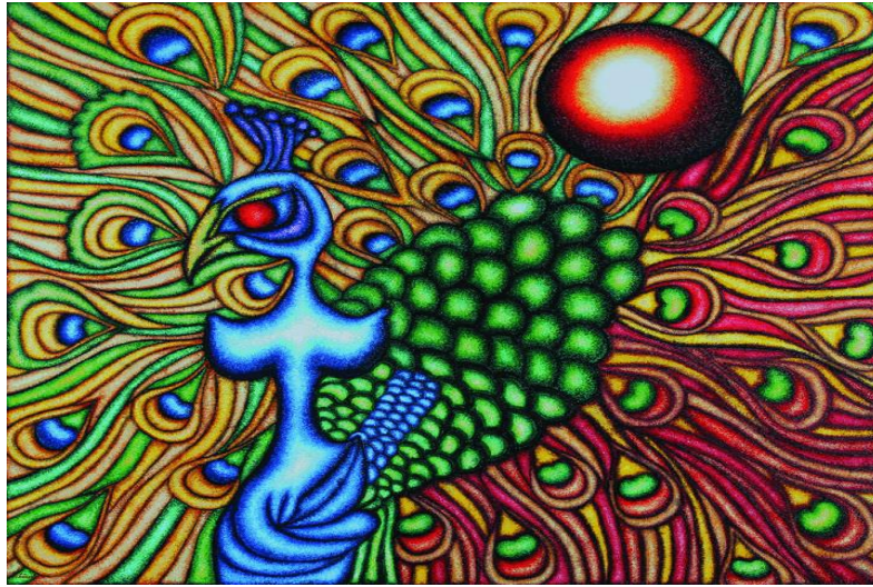
Resim-3 'Melek-i Tavus'

Resmin Yorumu: Sanatçımız eserinin sol tarafını karanlık, sağ tarafını aydınlık bırakmıştır. Sol taraftaki karanlık ile kötülüğe, ikiyüzlülüğe, fitneye ve fesatlığa yani Men-ü- Zin hikayesinde geçen Bekir karakterine vurgu yapmaktadır. Sağ tarafı aydınlık bırakarak iyiliğin, doğruluğun, suçsuzluğun zayıflığın ve çaresizliğin temsili Men ve Zin karakterlerine vurgu yapmaktadır. Mem-ü Zin destanına göre her şey zıttı ile izah edilir. Kötülüğün bilenmediği yerde iyilik tarif edilemez. Sanatçımızda eserinde tüm bu farklılıkların, zıtlıkların bir arada birbirine zarar vermeden, birbirinin görünümüne engel olmadan aynı zeminde de aynı sema altında yaşayabileceklerini anlatmaktadır. Eserin sol tarafında karanlıklar içinde bir güneş figürü kullanan sanatçımız, karanlığın içinden güneşin doğuşu gibi iyiliklerin parlayacağına, parlayan her bir ışığın yeni bir umut olacağına dikkat çekmektedir. (Resim-2)