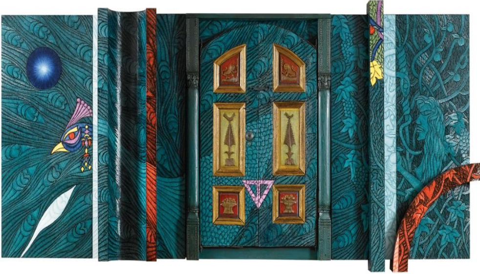
Resim-7 ' Cennet'in Kapısı '

Ahmet GÜNEŞTEKİN Cennet'in Kapısı eserini 2009 yılında 220x505 cm ebatlarında karışık teknik ile yapmıştır.