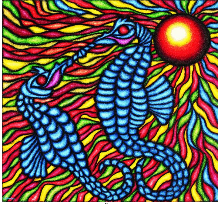
Resim-4 'Ölümsüz Aşk'

Ahmet GÜNEŞTEKİN eserini 2005 yılında yapmıştır. 140x140 cm ebatlarındaki eserinde tuval üzerine yağlıboya tekniğini kullanmıştır.